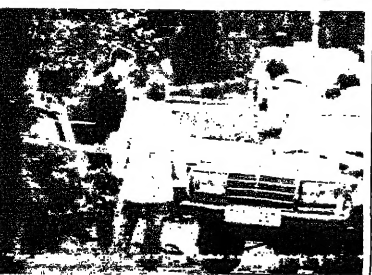
مقل جنود القتل في ألمانيا